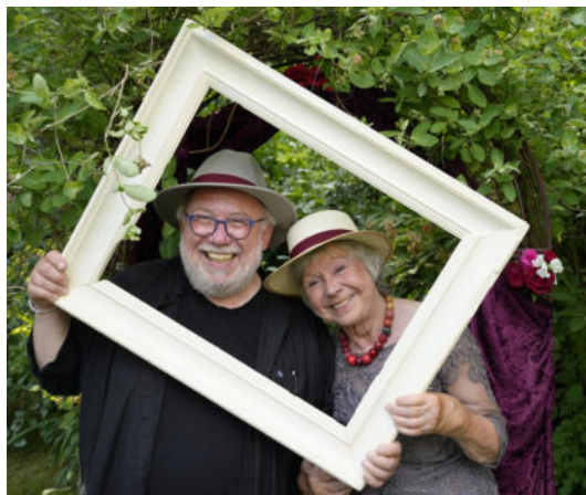
(25-jähriges PhytAro Jubiläum im Sommer 2023)

Liebe Heilpflanzen-, Naturheilkunde-, Aroma- und Ethnomedizin-Freunde!